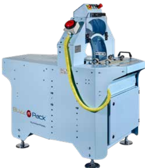
Buzz n'Pack 400er (für S, M, L)

Mit diesem Maschinensystem ist alles kinderleicht und perfekt verpackt. Dabei sind die Kosten immer gleich und im Tray-Preis eingerechnet. Das Maschinensystem wird Ihnen gestellt, Folie inklusive. Sie haben keine Schwankungen durch mehr oder weniger Füllmaterial. Versandgüter bis 10 kg sind kein Problem. Durch dazu perfekt konzipierte Umkartons und Verstärkungen ist der Versand schnell und sicher.