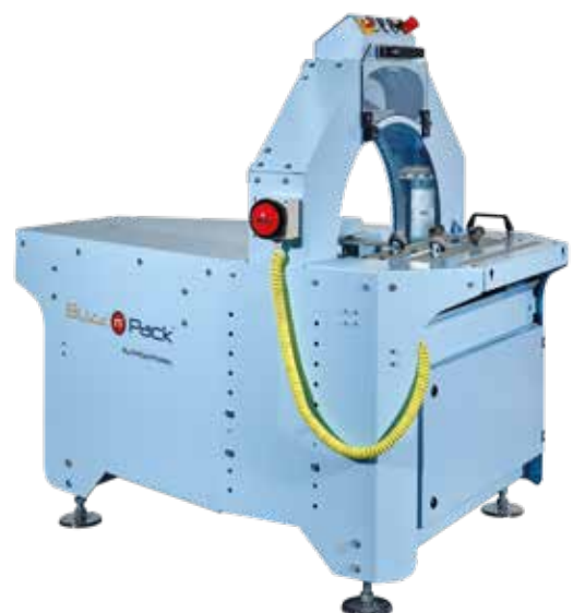
Buzz n'Pack 600er (für S, M, L und XL)